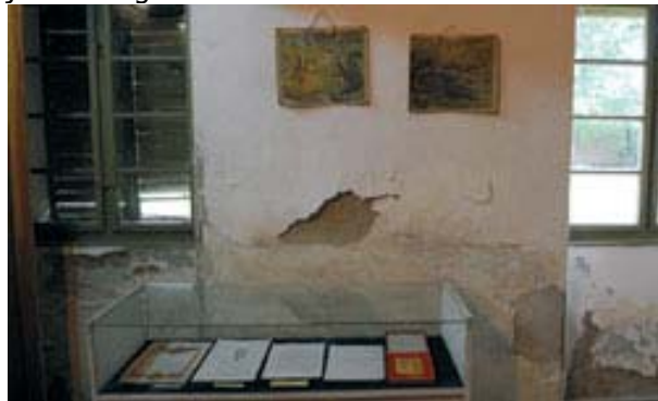
Pupinov muzej nalazi se u zgradi nekadašnje škole

NEMA meštantina banatskog sela Idvor koji ne zna, onako „iz ruke“, bar jednu anegdotu o Mihajlu Pupinu. Makar onu o srpskom pastirčetu koje je u Ameriku došlo sa pet centi u džepu i uspelo da postane jedan od najvećih svetskih naučnika.