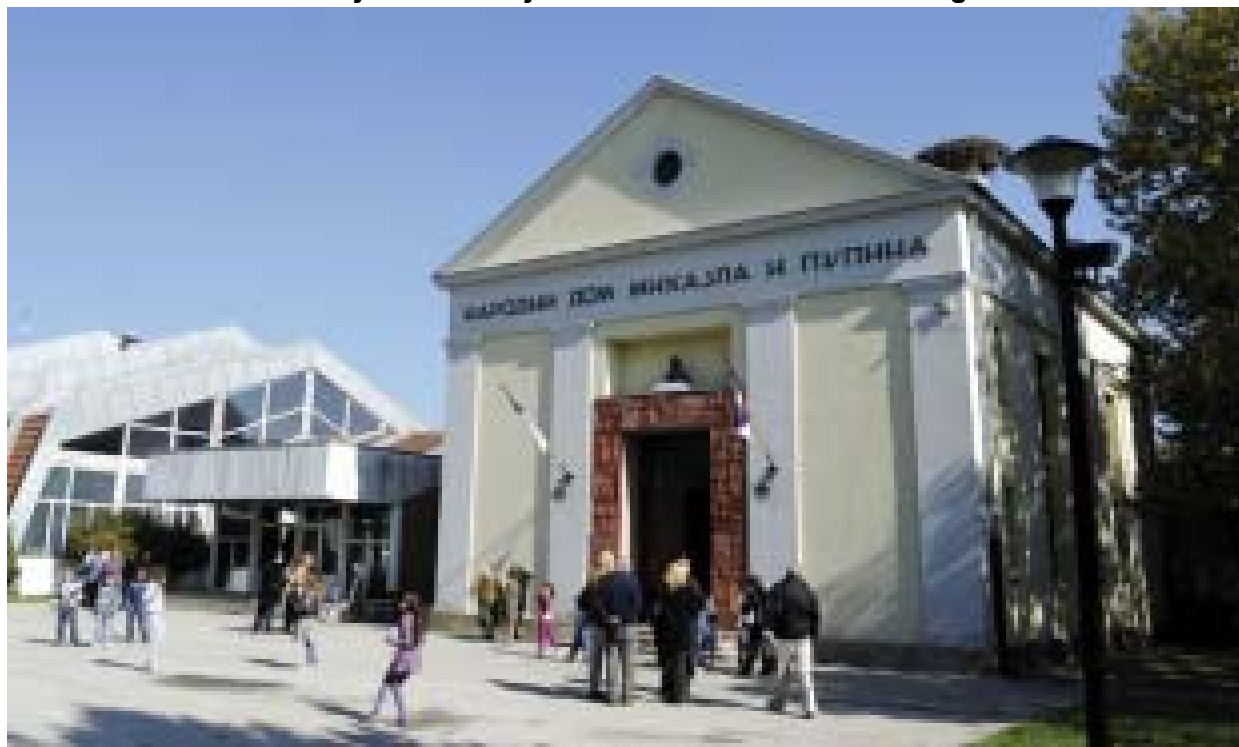
Deo muzejskog kompleksa

U rodnom selu slavnog naučnika tvrde da će izgraditi centar kakav je želeo njihov meštanin. Direktor Muzeja: Država i javnost su zaboravili na našeg velikana